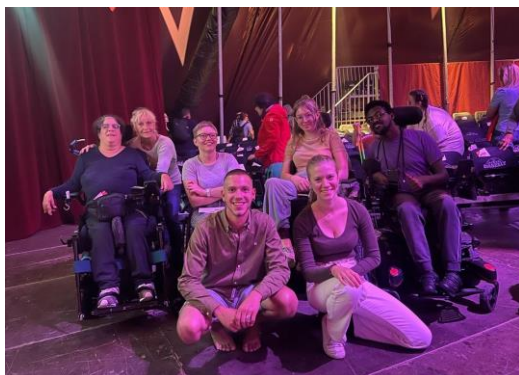
Eine Gruppe geniesst die Vorstellung im DAS ZELT