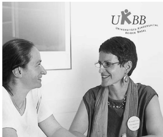
BELOP Ein Verein zur Begleitung der Eltern während der Operation ihres Kindes