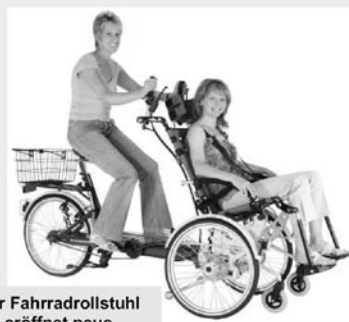
Der Fahrradrollstuhl eröffnet neue Möglichkeiten